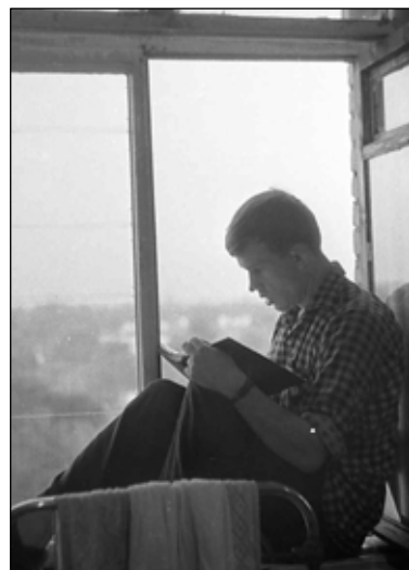
№ 42. ВГИК. Общага