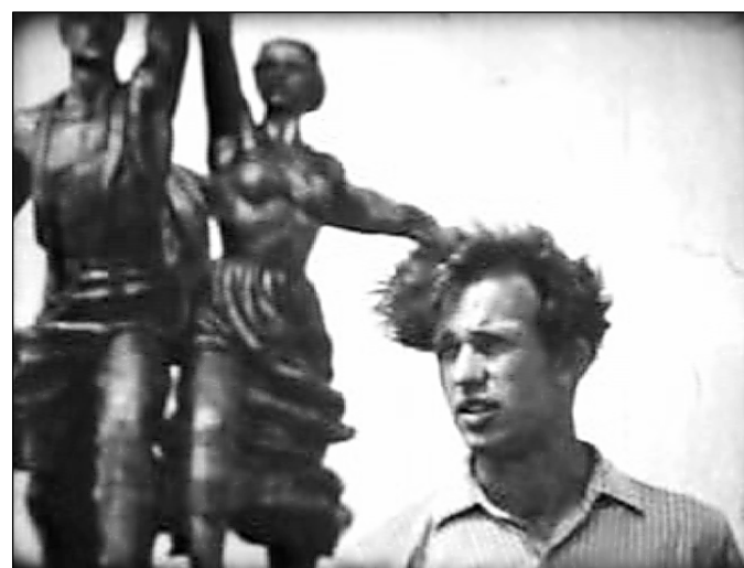
№ 44. Съёмка на ВДНХ