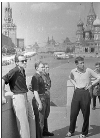
№ 41. Москва